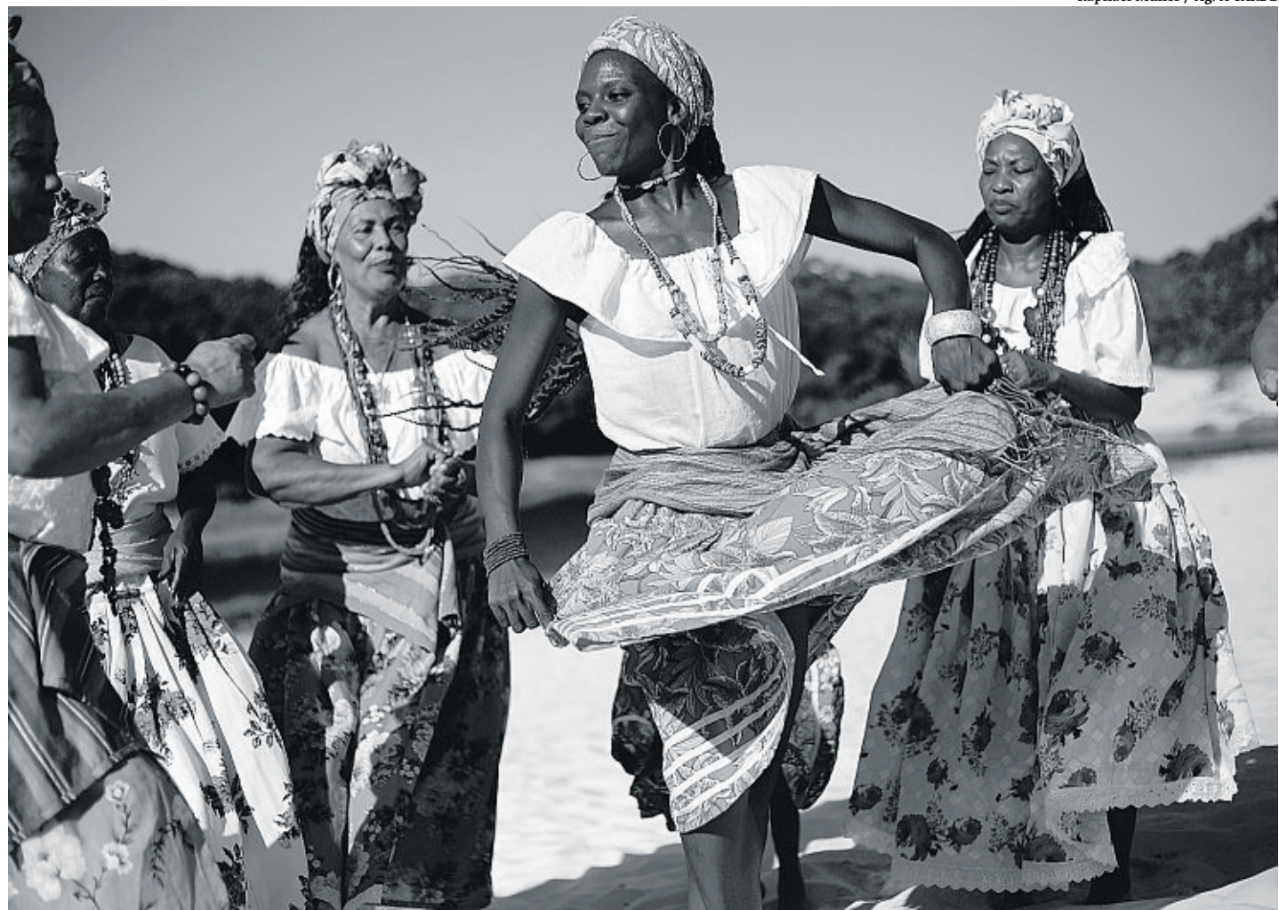
Com cantigas de roda, sambas e cirandas, mulheres mantêm viva a cultura local e perpetuam legado ancestral

Ao todo, são dez músicos, dez cantoras, dez sambadeiras e dez crianças. A mais nova tem 3 anos de idade e a mais antiga, 80 anos. Para as participantes, essa é a melhor forma de transmissão